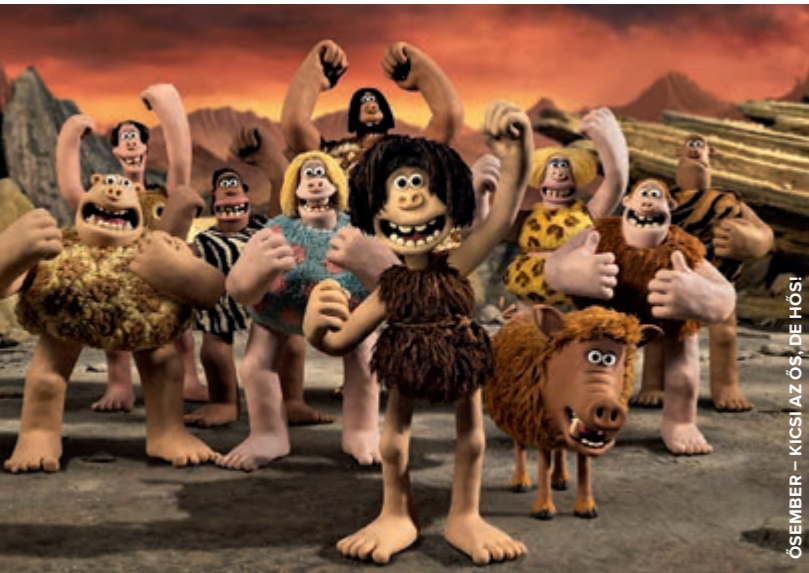
ŐSEMBER – KICSI AZ ŐS, DE HŐSI

Idén kéz a kézben jár a farsangi szezon és a Valentin-nap, hiszen előbbi utolsó napja éppen február 14-ére esik. Kell ennél több, hogy jól érezzük magunkat ebben a hónapban?