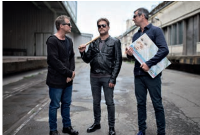
VALAMI AMERIKA 3.

Díjakban és közönségsikerekben gazdag évet zárt tavaly a hazai filmgyártás – idén pedig tükön ülve várhatjuk a folytatást. Sorra vettük, mikkel készül a filmes szakma.