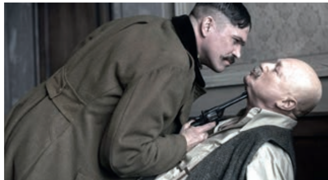
A HENTES, A KURVA ÉS A FELSZEMŰ

Több mint 1,2 millió! Tavaly összesen ennyien váltottak jegyet hazai alkotásra, a három legsikeresebb mozi (Kincsem, A viszkis, Pappa Pia) pedig mind 200 ezres nézőszám felett zárt – ezt a Filmalap fennállása óta csak az Oscar-díjas Saul fia tudta elérni. Hogy minek köszönhető ez a bizakodásra okot adó eredmény? A tudatos marketingstratégiának legalább annyira, mint a Filmalap által elsődleges szempontként megjelölt precíz forgatókönyv-fejlesztésnek. Ami az ideji évre is tartogat nézniezőket. A legjobban várt alkotás egyértelműen a február 15-én bemutatásra kerülő Valami Amerika 3. része. Herendi Gábor igazi sikergyáros rendező, eddigi négy filmjéből három is 400 ezer néző felett zárt, és