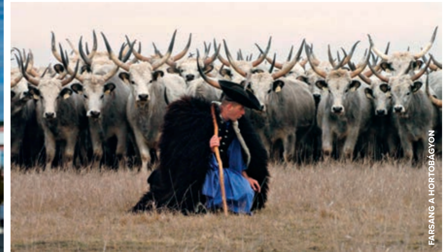
FARSANG A HORTOBÁGYON