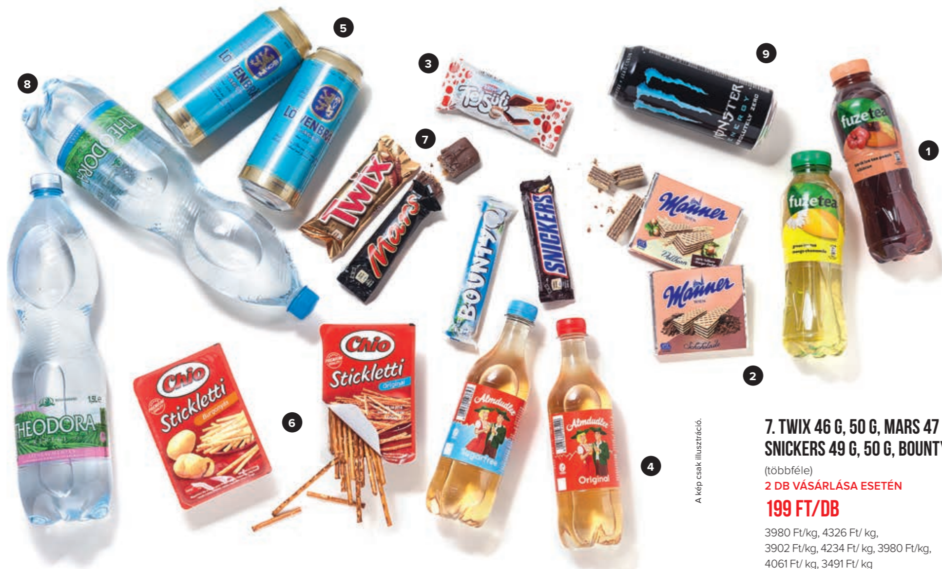
A kép csak illusztráció.